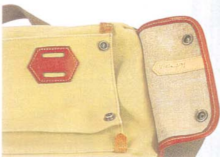
DIE ANGEKNÖPFTEN SEITENTASCHEN SIND ABNEHMBAR UND AM GÜRTEL ZU TRAGEN.

Und in der Tat: Es gibt nur eine, die sich mit der Fogg messen kann. Im Guten (Schutz) wie im Gewöhnungsbedürftigen (Handhabung) wie im Nicht-Diskutablen (Aussehen) sind Fogg und Billingham einander in weiten Teilen zum Verwechseln ähnlich. Grob überschlagen kostet eine vergleichbar große Billingham (die trotz Ihres Nimbus erstaunlicherweise zu den Preiswertesten unter den Besten gehört) etwas mehr als die Hälfte, verzichtet aber auf die Individualität der Fogg (Seriennummer, Namensschild) und kann auch in einigen piffigen Details (anklippsbare Innendeckel, Schlaufen und Taschen auf dem Überwurfdeckel) nicht ganz mithalten. In der Summe kann eine Fogg sich gegen die Konkurrenz hochwertiger Taschen durchaus sehen lassen. Sie ist angesichts der Tatsache, dass es sich hier um reine Handarbeit handelt, nicht überteuert und vermag jenes beruhigende Gefühl der Solidität und Exklusivität zu vermitteln, die guten Manufakturprodukten eigen sind.