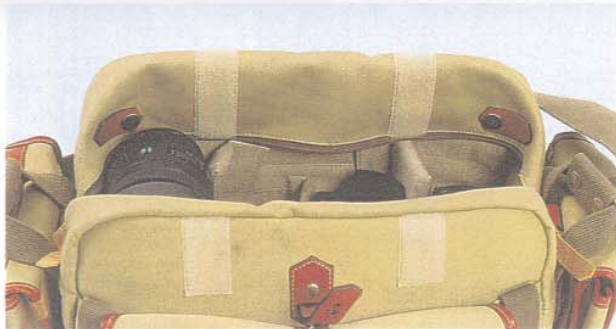
BEQUEMER ZUGRIFF: DIE DECKELHÄLFTE KANN MAN EINKLAPPEN UND FIXIEREN.