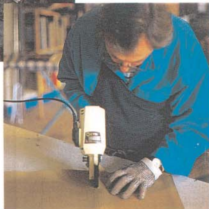
DAS LEDER WIRD DORT PRÄPARIERT UND FIXIERT, WO SPÄTER KANTEN ENTSTEHEN UND GENÄHT WERDEN SOLL.

Alle vier Taschen des Quartetts haben einen Überwurfdeckel, der Innenraum kann zusätzlich per Reißverschluss geschlossen werden. Wird dieser geöffnet, dann stört normalerweise der mittig geteilte Innendeckel, denn er hängt beidseits über die Ausrüstung und muss für jeden Zugriff beiseite geschoben werden. Nicht so bei einer Fogg: Die Deckelhälften lassen sich mit Druckknöpfen im Tascheninnern fixieren.