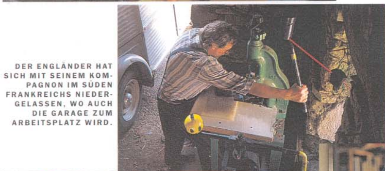
DER ENGLÄNDER HAT SICH MIT SEINEM KOMPAGNON IM SÜDEN FRANKREICHS NIEDERGELASSEN, WO AUCH DIE GARAGE ZUM ARBEITSPLATZ WIRD.