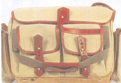
DER HANDGRIFF LÄSST SICH ÜBER DEN VORDER-TASCHEN FESTKNÖPFEN UND IST DAMIT AUFGERÄUMT.